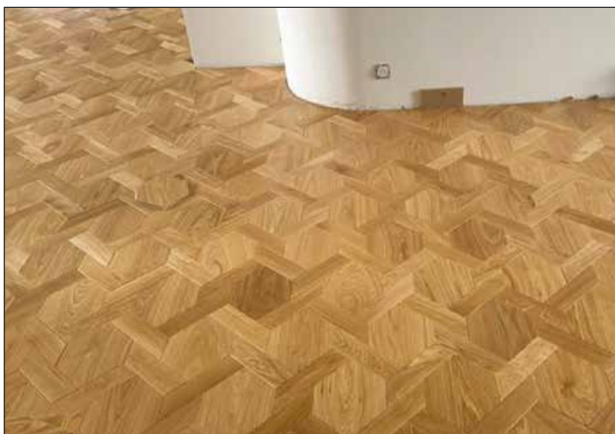
Vendôme - Verni mat