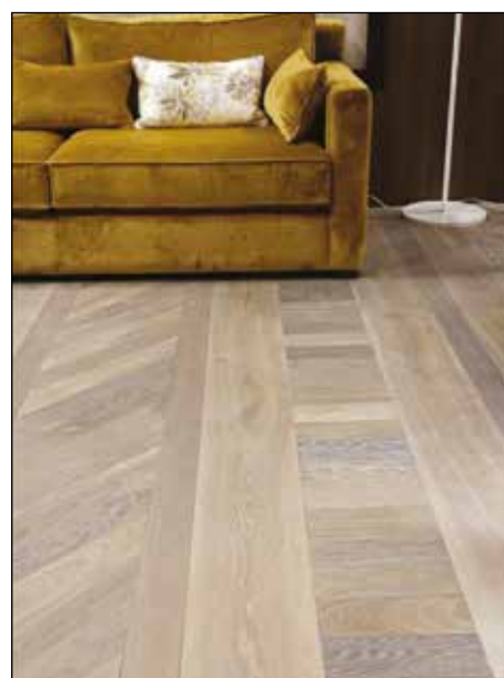
Veilleur de nuit - 2 AN VDF 917