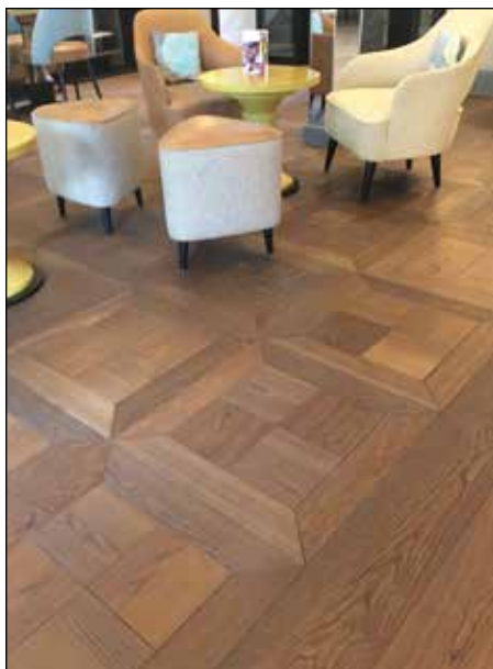
Damier cubique - VDF 900