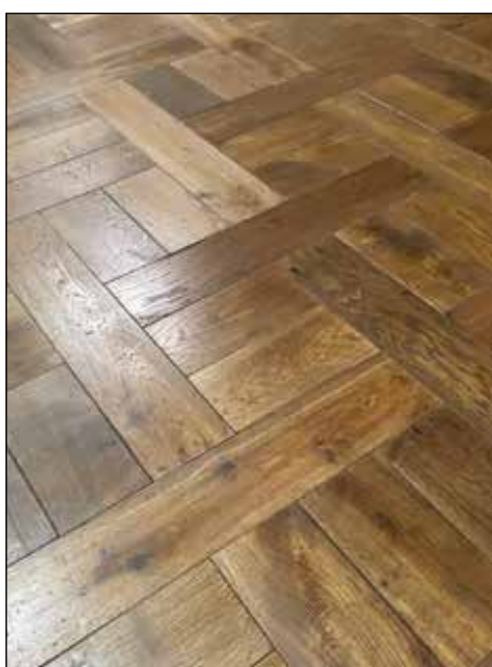
Damier entrelacé - PA 98 Club 98 ciré