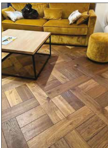
Damier entrelacé PA 94 Gallery ciré