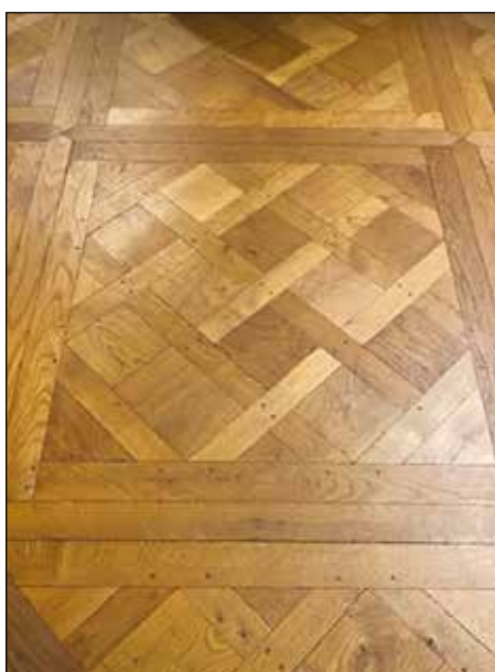
Versailles avec navettes PA 5 doré antique