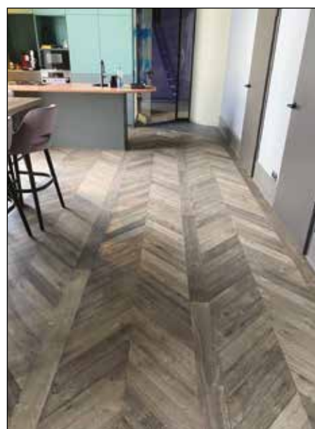
Point de Hongrie pose en fougères - PA 801