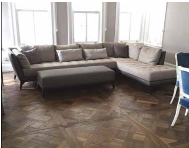
Versailles - Route 66