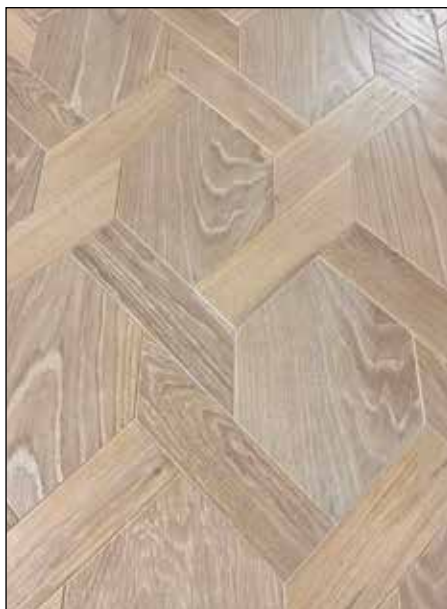
Vendôme - Brossé blanchi