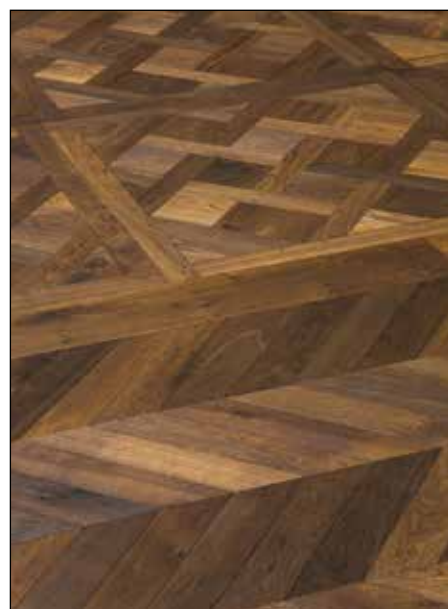
Versailles et point de Hongrie - Route 4