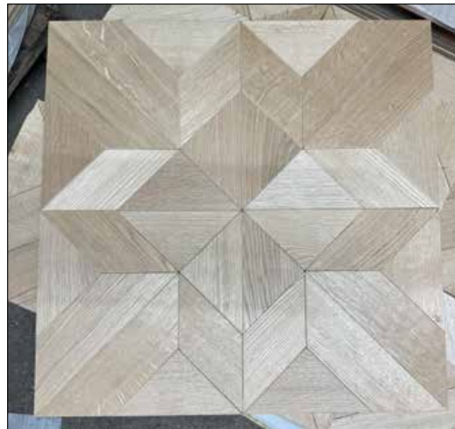
Croix de Vienne