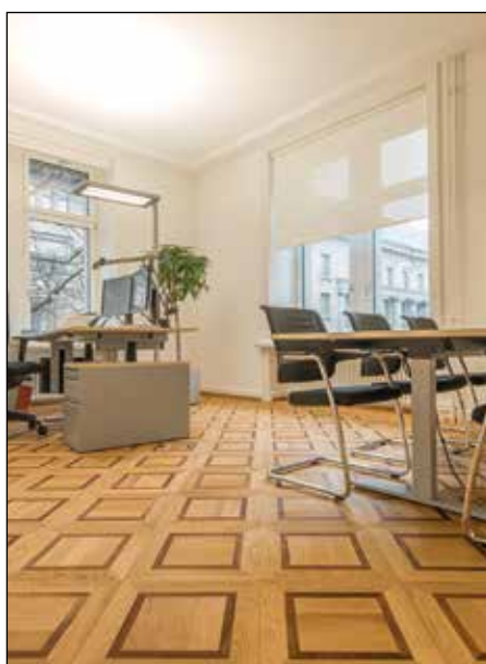
Cubique avec liseret en noyer