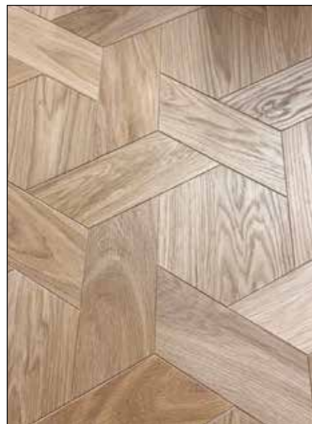
Hexagone - Brossé huilé