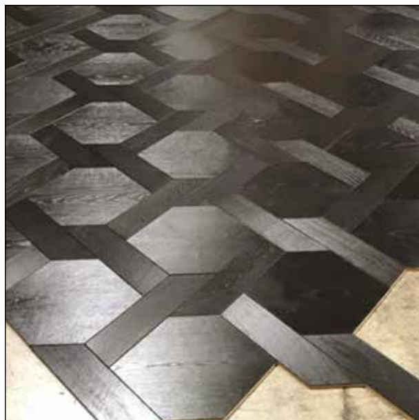
Vendôme - PE 410 B Extrême brossé noir