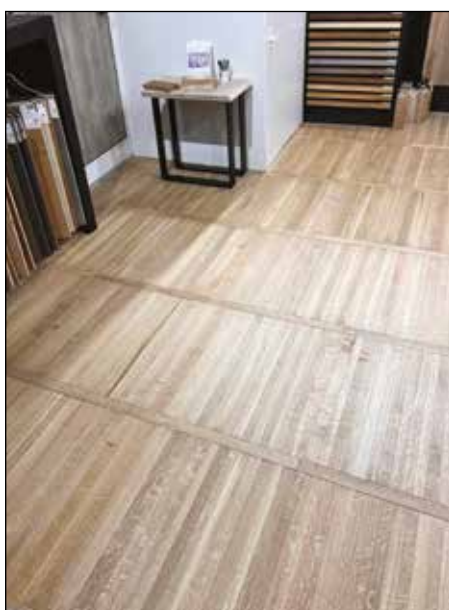
Chêne scié Barrique - SCV 681 verni