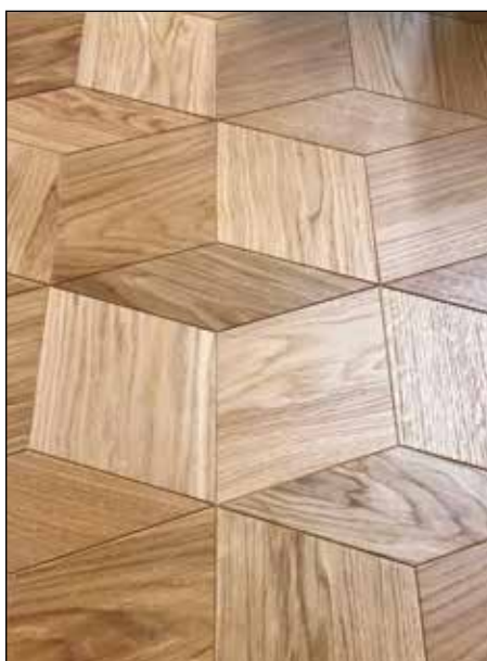
3D - Huilé