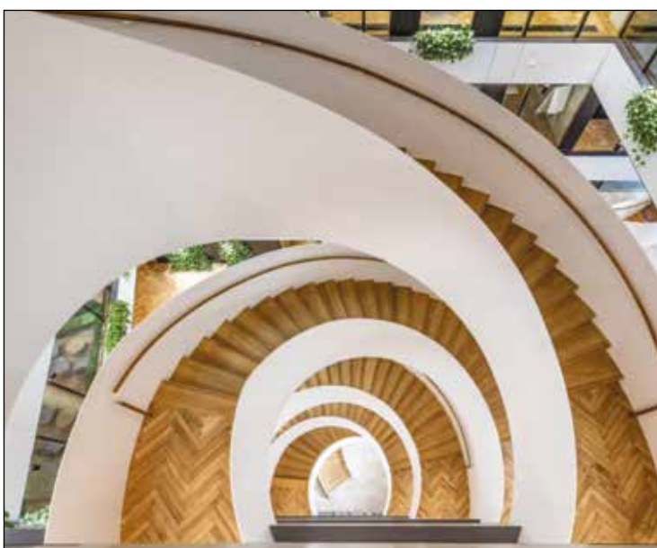
POST LUXEMBOURG - Bâton rompu - Escalier, espace d'accueil, bureaux - PA 5 doré antique