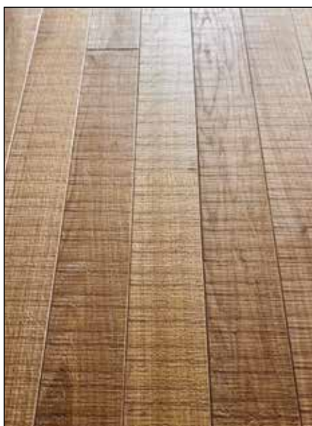
Chêne Elégance - largeur 60 - SCV 681 verni