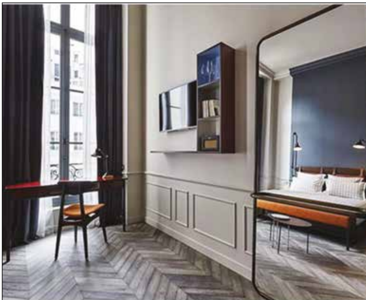
THE HOXTON HOTEL - Point de Hongrie - PA 801