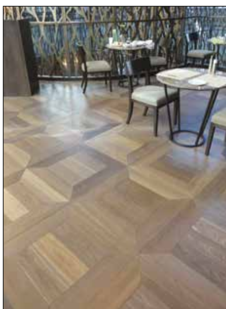
Cubique - Col 108 SD structuré double huilé