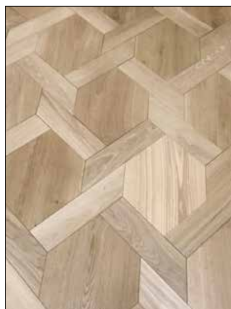
Vendôme - Brossé huilé